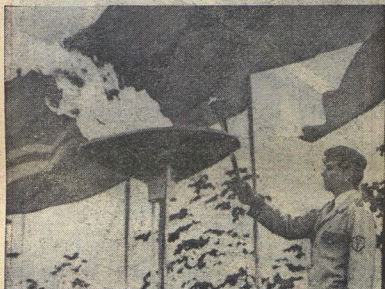
Лучшим «орлятам» будет вручен приз «Пионерской правды», который подготовили им зарничинки. Но пока идут соревнования.