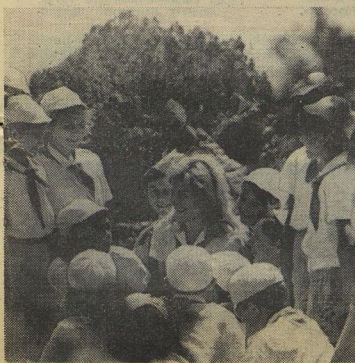
Штаб слёта выбирают прямо на берегу моря.

В эти дни Артек напоминает шумный клуб путешественников. Четыре года продолжалось путешествие по дорогам маршья «Всегда готов!» Дороги эти пролегли везде, где действовали пионерские отряды. Ребята приехали в Артек на слёт рассказать о своих делах и составить карту новых маршрутов.