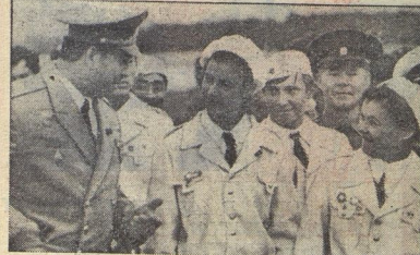
Плох тот солдат, который не мечтает стать генералом. «Орлята» мечтают... И поэтому, когда рассказывает генерал-майор Г. Т. Береговой, ребята идут наидоже.